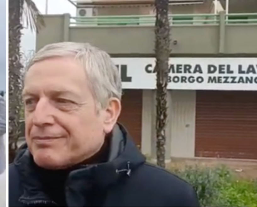
In visita a Borgo Mezzanone, Foggia