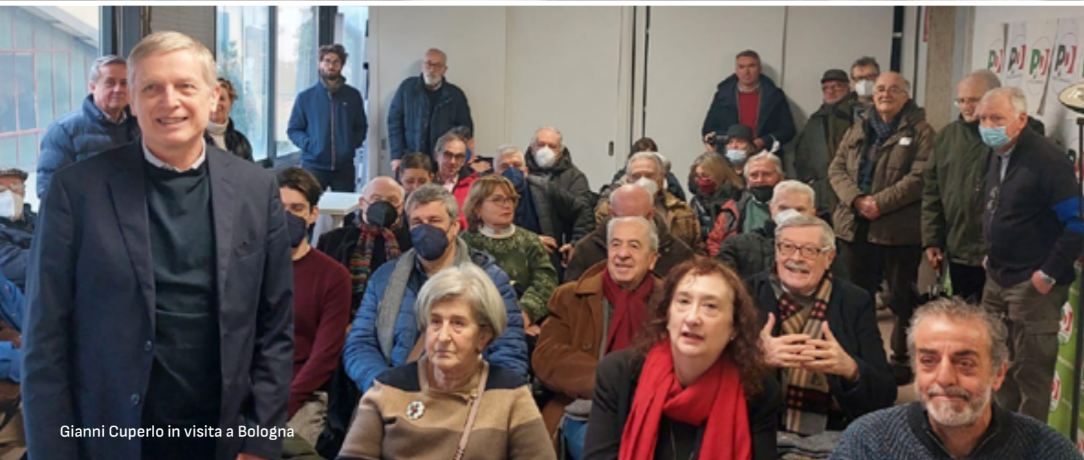
Gianni Cuperlo in visita a Bologna