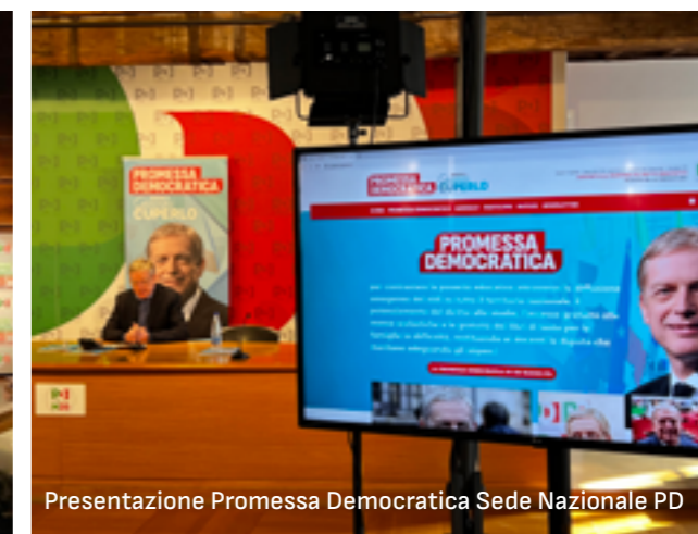
Presentazione Promessa Democratica Sede Nazionale PD