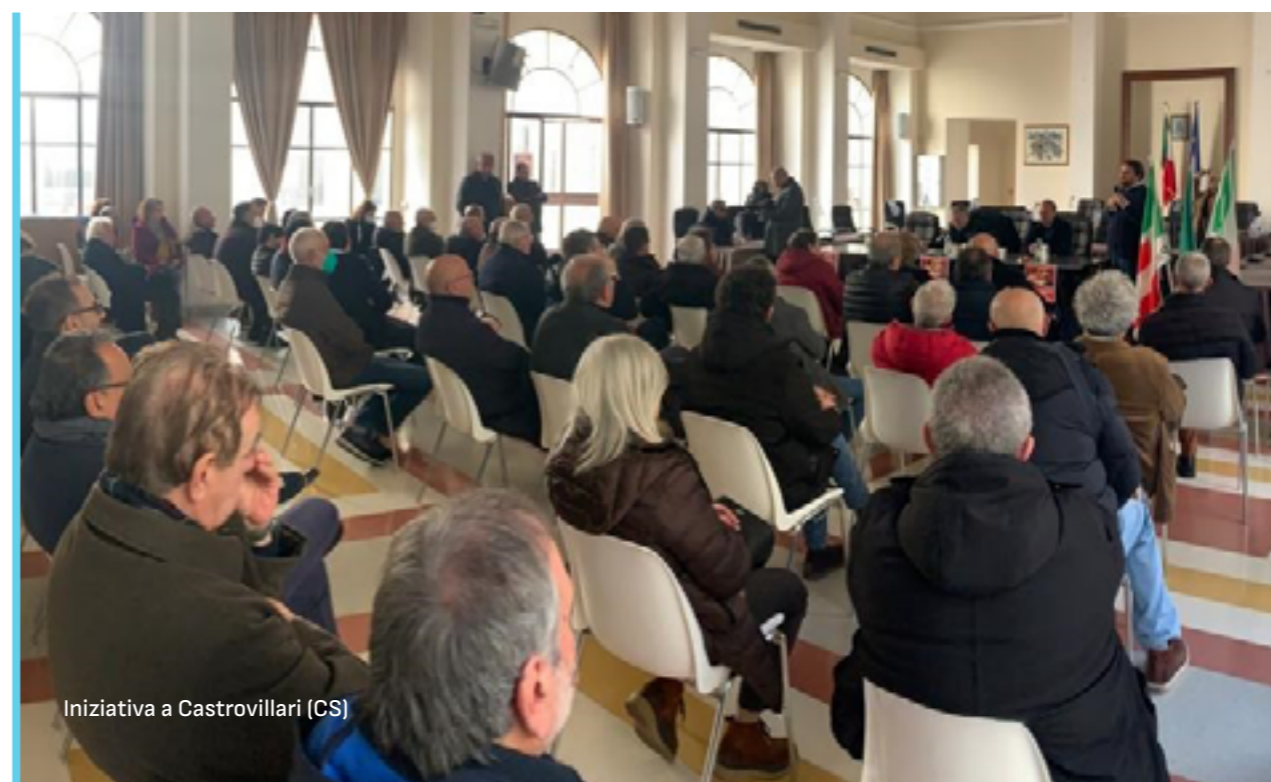
Iniziativa a Castrovillari (CS)