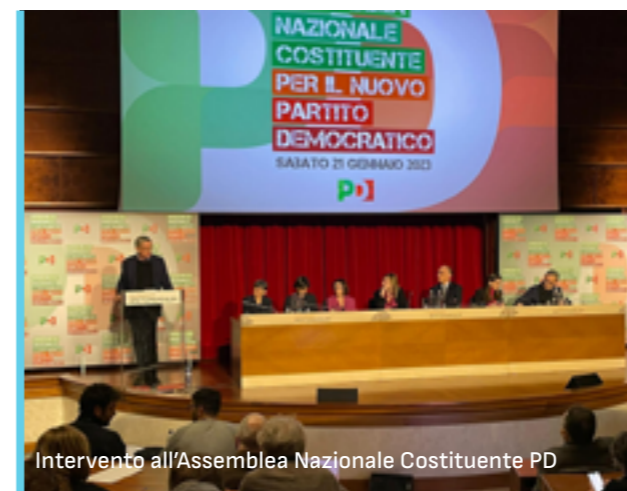
Intervento all'Assemblea Nazionale Costituente PD

Ma soprattutto è il momento per farlo. Insieme.